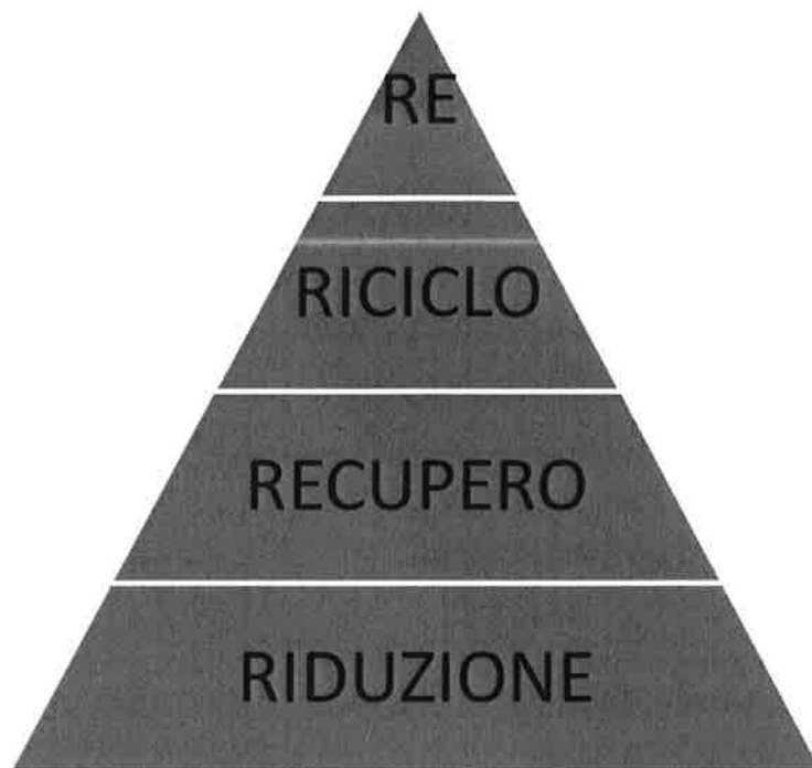
Tabella : Il principio delle 4 R

Pertanto, la discarica riveste un ruolo residuale, per i soli rifiuti inerti e residui dalle operazioni di riciclaggio, recupero e smaltimento precedentemente ricordate.